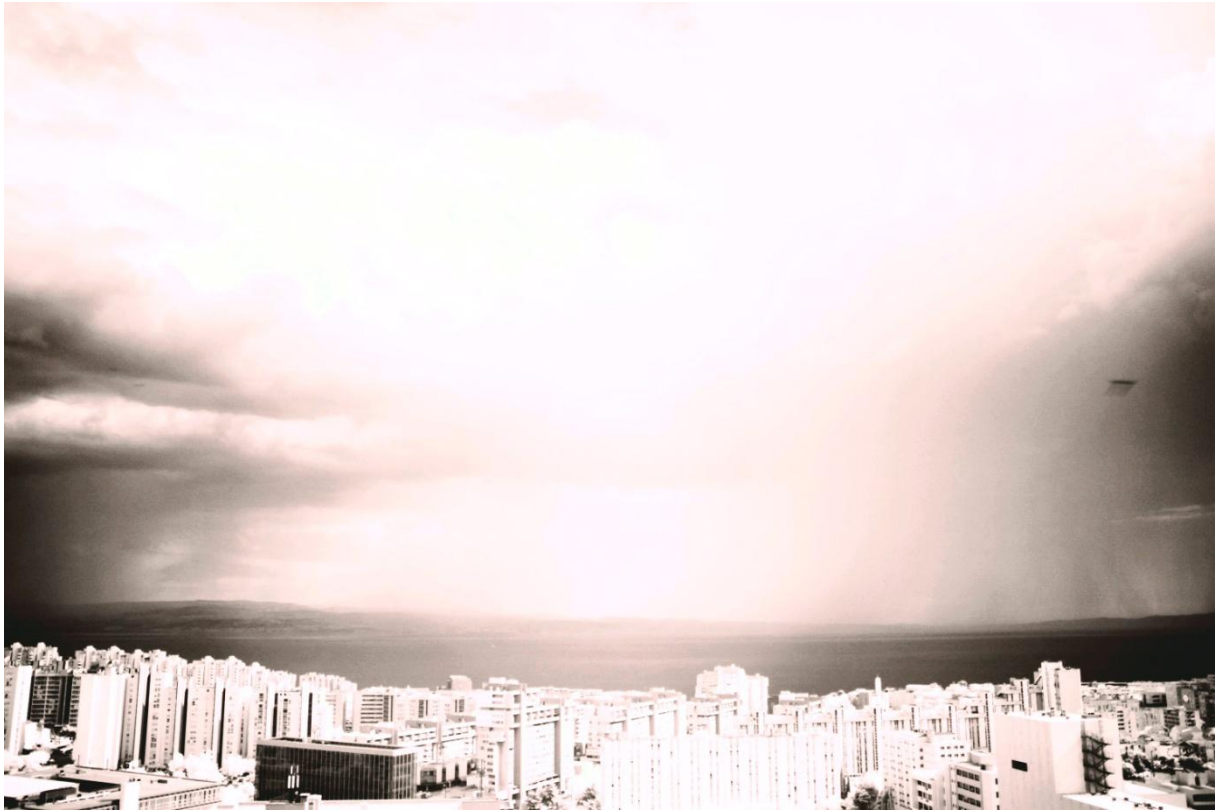
Slika IC aparat FUJI FILM Pro

Član Polarisa Goran Artić 25.05.2011.godine oko 17,00 sati, slikajući nevrijeme iznad Splita i hvatajući munje slikao NLO, koristio je IC aparat FUJI FILM pro s širokokutnim objektivom a postavljen je na postavke ISO125, f4, 1/40sek. Pregledavajući ostale slike koje je slikao prije i poslije nije pronašao navedeni objekt.