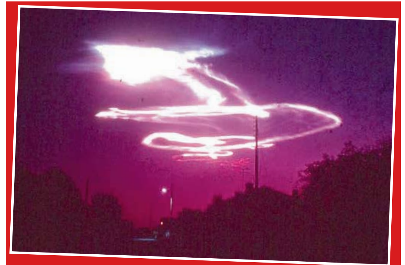
Francuska svemirska agencija CNES u ožujku 2007. godine otvorila je posebnu web stranicu na kojoj su javnosti podastri dosjei o NLO viđenjima u posljednjih 50 godina. Od 1.600 tada objavljenih slučajeva, četvrtina njih od danas nije objašnjena. Drugim riječima, klasificirani su kao „kategorija D“, što znači „neobjašnjivi slučajevi uz sve poznate podatke“. Inače, Francuska je prva zemlja na svijetu koja je javno objavila svoje dokumente o „malim zelenima“.